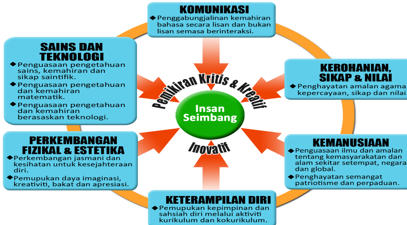
Bentuk Kurikulum Transformasi