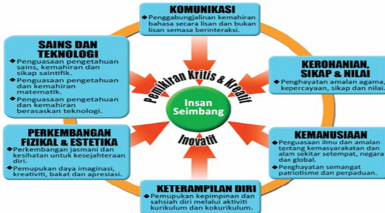
Bentuk Kurikulum Transformasi