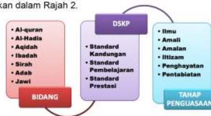
Rajah 2: Organisasi Kandungan dalam Kurikulum Pendidikan Islam

Kandungan Pendidikan Islam boleh dikembangkan melalui proses p&p yang dijalankan sehingga murid berkebolehan mencapai tahap-tahap penguasaan yang ditetapkan dalam Pendidikan Islam iaitu ilmu, amali, amalan, iltizam, penghayatan dan pentabiatan. Enam Tahap Penguasaan tersebut merupakan indeks kemenjadian murid yang dihasratkan dalam kurikulum Pendidikan Islam. Organisasi kandungan dalam kurikulum Pendidikan Islam dapat ditunjukkan dalam Rajah 2.